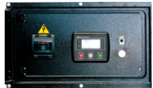
Panou comanda tip QFIA-4520

Protectie IP 65 Temperatura de lucru -20° + 70°C Temperatura depozitare -30°C +80°C